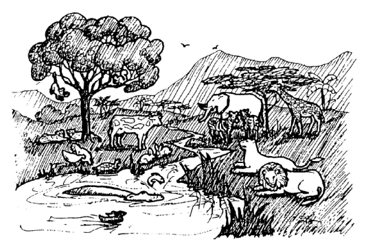
© 2015, World Missionary Press, Inc. Illustration på omslaget af Edwin B. Wallace. Meryl Esenwein, illustration på denne side og side 10, 12, 14, 16, 27, 29, 39, 41, 42, 44, 46, 47 og 48. Den anførte Bibeltekst er fra Bibelen, ©1992 med tilladelse fra Det Danske Bibelselskab.